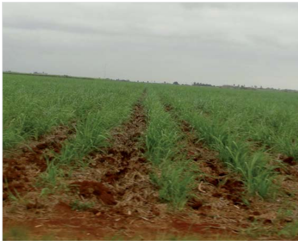
Foto 13 – Foto panorâmica da produção agrícola na região de Artemisa, Cuba.

Mesmo inclinado pelo objetivo da visita pela área da Educação Física, percebemos uma grande possibilidade de parcerias na área da agricultura familiar, pois a região de Artemisa é uma das principais produtoras agrícola de Cuba. Ademais, durante esses encontros nos reunimos por área temática: 1-Ciências Humanas, 2-Cultura Física/ Educação Física e 3- Agroecologia.