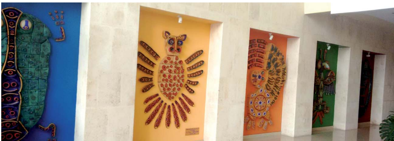
Foto 07 e 08 – Painéis com obras de arte no salão de entrada da Embaixada do Brasil em Cuba.