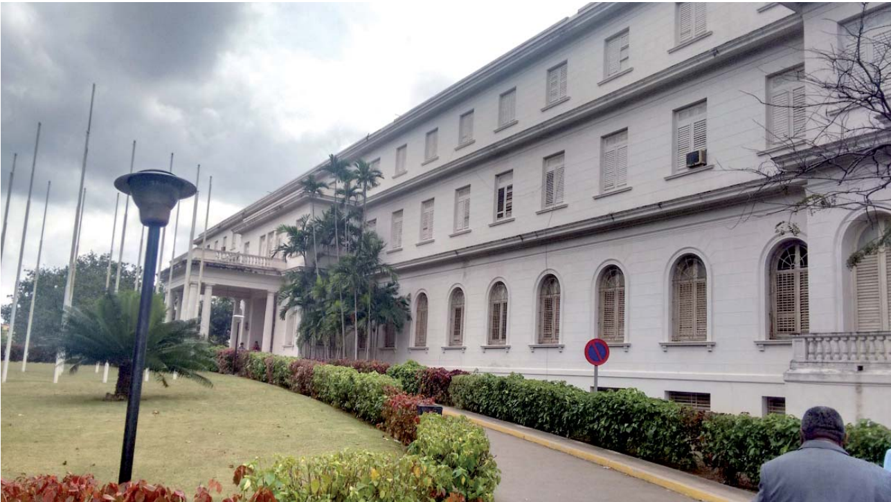
Fotos 03 e 04- Prédio da Reitoria do Instituto de Ciências Médicas.