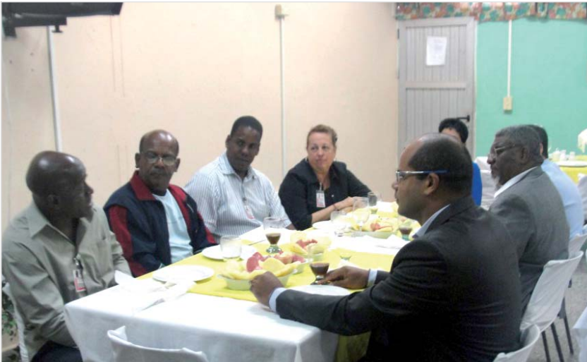
Foto 11 – Recepção dos Pesquisadores da Universidade de Artemisa, Cuba.

Saímos de Havana as 8h30min com destino a cidade de Artemisa, aproximadamente 40 min de deslocamento de carro.