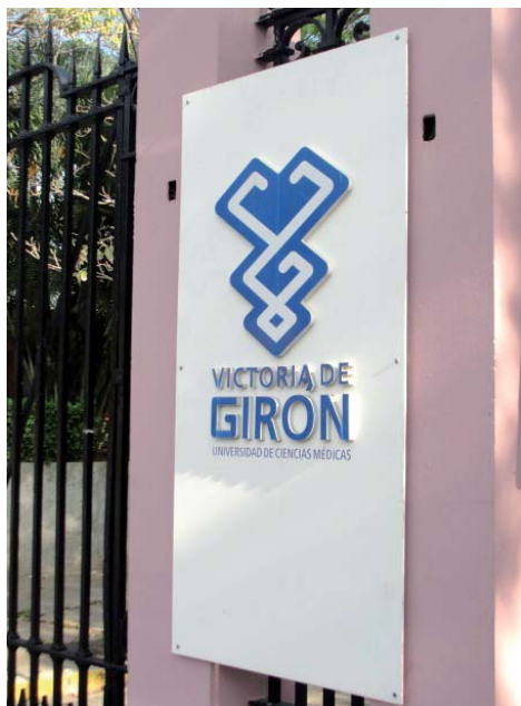
Foto 01-Entrada do Instituto de Ciências Médicas.

Dia 17/03 Chegamos a Cuba por volta das 13h30min no horário local. Após realizado check in fomos para o Hotel Copacabana. Em seguida fomos ao Instituto de Ciências Médicas de Havana, Victoria de Giron, a procura do Dr. Eduardo Allemany, ocasião em que fomos informados que o mesmo estava em missão na Venezuela a mais de 15 dias. Na oportunidade, contactamos o Departamento de Relações Internacionais da referida Universidade, onde fomos recebidos pela Sra. Maria Helena, a qual informou-nos que estavam em campanha nacional contra o mosquito aedes aegypti com a presença do Reitor, professores e alunos. Fomos orientados pela diretora do Departamento de Relações Internacionais a buscar apoio junto ao Ministério de Saúde Pública de Cuba e a Empresa de Serviços Médicos Cubanos.