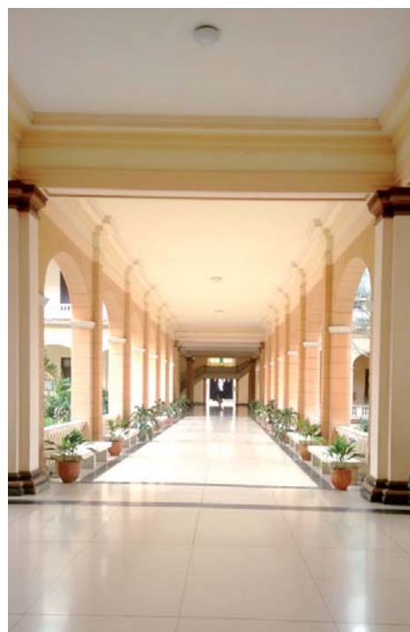
Foto 2-Salão de Entrada do Instituto de Ciências Médicas.