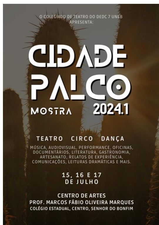
Figura 1 - Clique aqui para baixar a imagem

Senhor do Bonfim, BA – O curso de Licenciatura em Teatro da Universidade do Estado da Bahia (UNEB), Campus VII, tem o prazer de anunciar a Mostra Cidade Palco 2024.1, um festival que promete encantar a todos com uma rica programação artística e cultural. O evento acontecerá nos dias 15, 16 e 17 de julho de 2024, no Centro de Artes Prof. Marcos Fábio Oliveira Marques, localizado no Colégio Estadual no centro de Senhor do Bonfim.